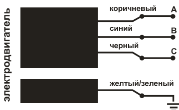
Рис. 4 Принципиальная электрическая схема

Наращивание электрического кабеля должно осуществляться посредством термоусадочной муфты с клеевым внутренним слоем, обеспечивающим герметичность соединения.